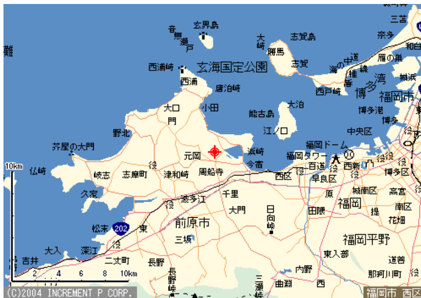
図 1. 元岡地区の場所

福岡市西区元岡地区（下の地図中央の赤い点）。 最寄り駅はJR 筑肥線の周船寺（すせんじ）駅。