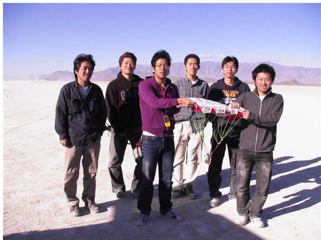
図1：アメリカで行なわれた CanSat コンペ

プロジェクトでは主に、テザー宇宙ロボット技術実証衛星 STARS の開発を中心としており、関連技術の蓄積を目的とした CanSat 開発も行っています。