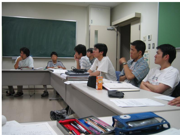
図 2：プロジェクト会議

大学外の大人の人たちによる支援団体があったり、中高生もプロジェクトに参加していたり。具体的な衛星開発には携わるのは難しくても、宇宙を知ってもらおうという意味でいろいろなイベントを企画してきたりしました。