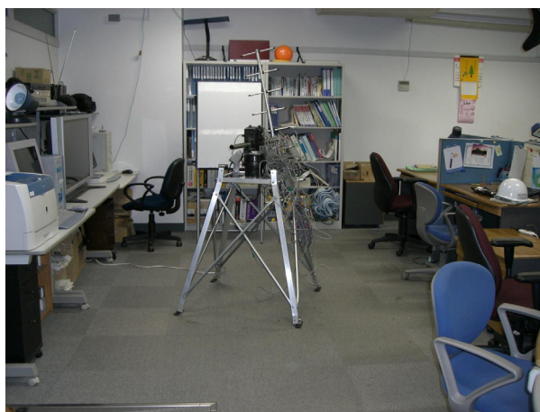
図 5 : 研究室の様子 (居室)