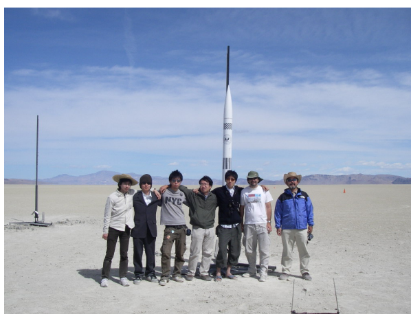
図 2~4 : ARLISS の様子