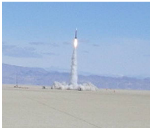
図1：ARLISSでのロケット打ち上げ