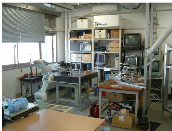
図 6 : 研究室の様子 (実験室)